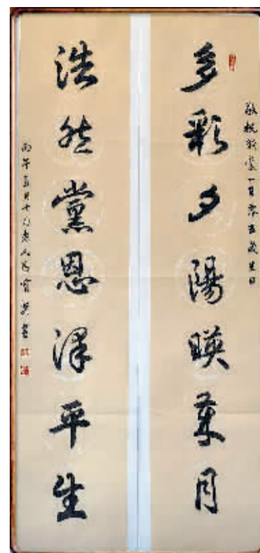
多彩夕阳映岁月 浩然党恩泽平生