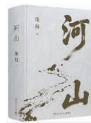
本栏目图书由秋林书城推荐