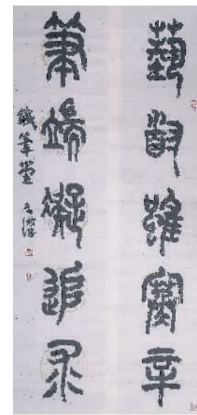
艺道虽寒辛 笔端凝追求 万朝峰/书