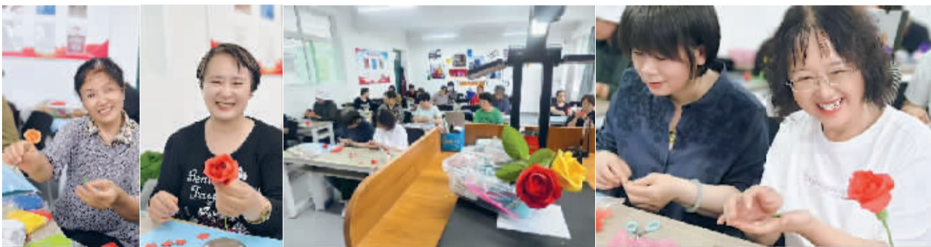
银龄学子不惧风雨，坚守求学本心，奔赴课堂充实自我。

窗外雨声簌簌，雨幕笼罩全城，路面积水潺潺。狂风裹挟骤雨，给出行平添不少阻碍。这般天气，多数人会选择居家避雨，暂缓外出行程。