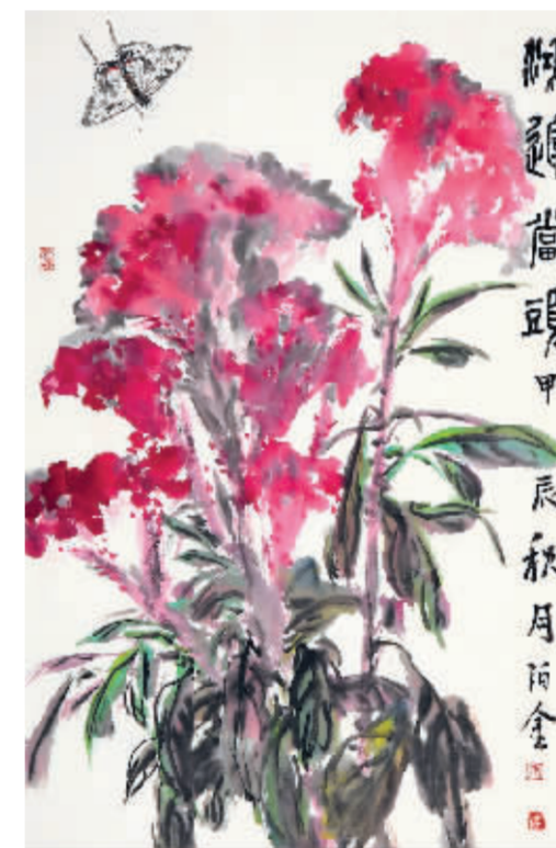
鸿运当头 安泊金/作