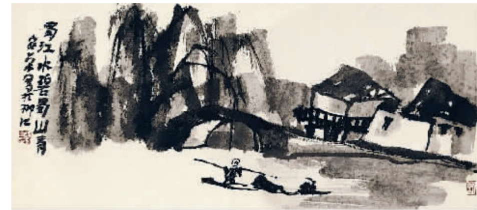
柳江古镇写生 韩安荣/作