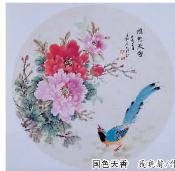
国色天香 聂晓静/作