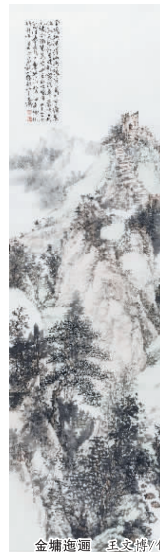
金塘迤迤 王文博/作