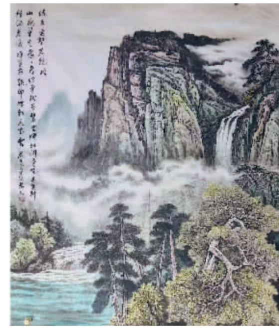
峰峦翠色 秦安民/作