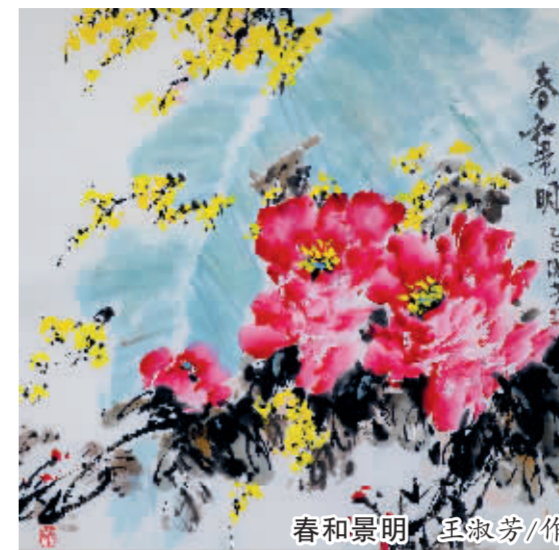
春和景明 呈淑芳/作