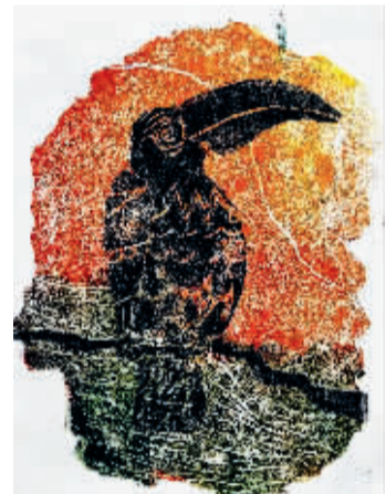
非遗手工坊教师作品

课程以非物质文化遗产手作技艺为核心,设置版画、瓷画、蓝染等多种传统工艺实践模块。课程适度融入 AI 数字技术,通过影像记录、图案设计与创新应用等案例,助力非遗的当代活化与跨代传承。本课程非常适合喜爱传统文化、乐于动手创作的学员参与学习。任课教师:石幼专胡悦团队。