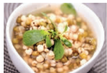
清热解毒药膳马齿苋绿豆粥

课程教授中医理论、中医药膳知识及正宗药膳配方,以四季养生为基础,结合人体体质特点,指导学员理解食物功效、掌握搭配原则,制定个性化食谱,助力自身及家人调理身体、提高免疫力,调节内分泌、延缓衰老、改善体质。任课教师:医大一院中医团队。