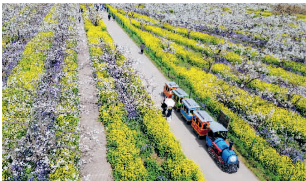
石家庄市晋州市周家庄农业特色观光园