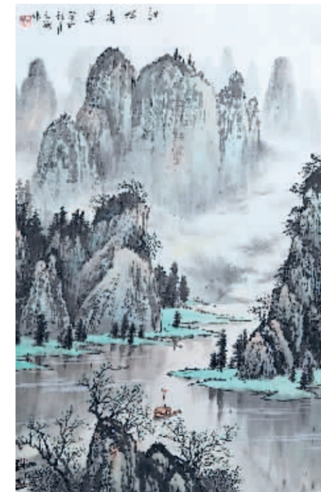
江畔春早 白文斌/作