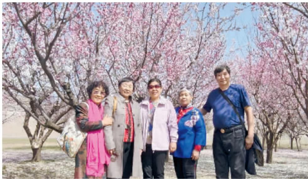
今儿个真高兴