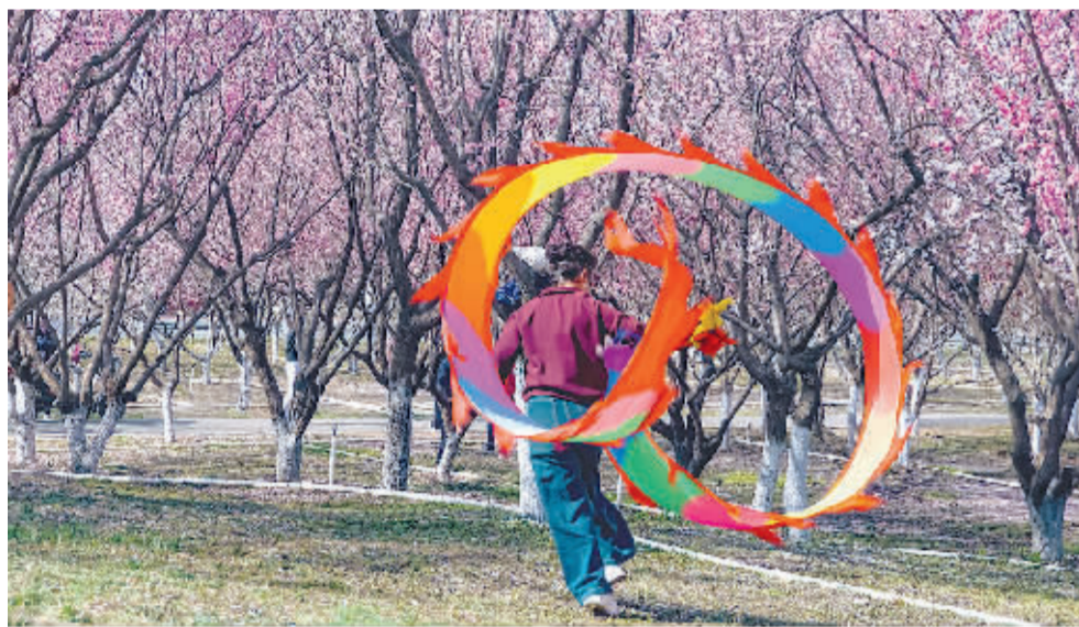
轻舞飞扬