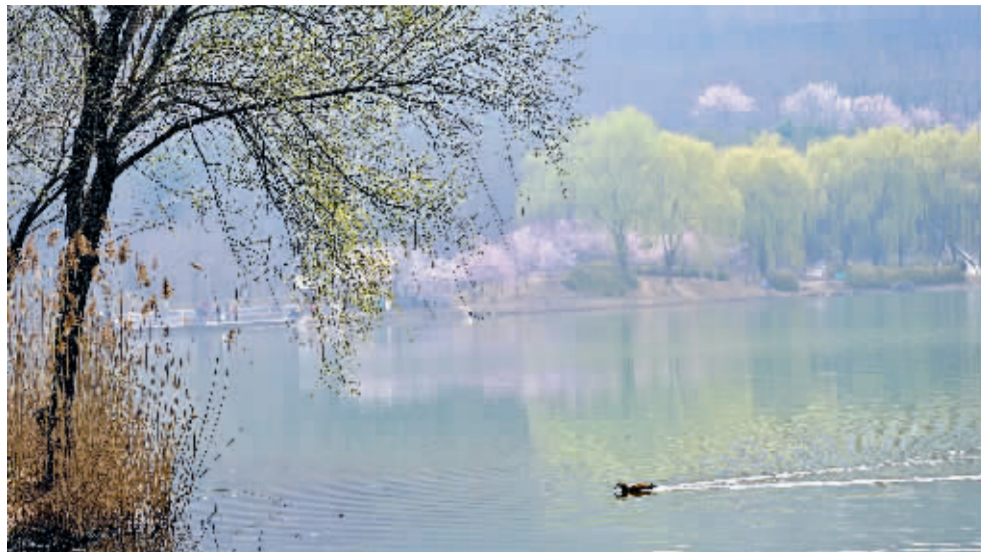
春江水暖