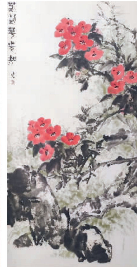
春到花先知 段炼/作