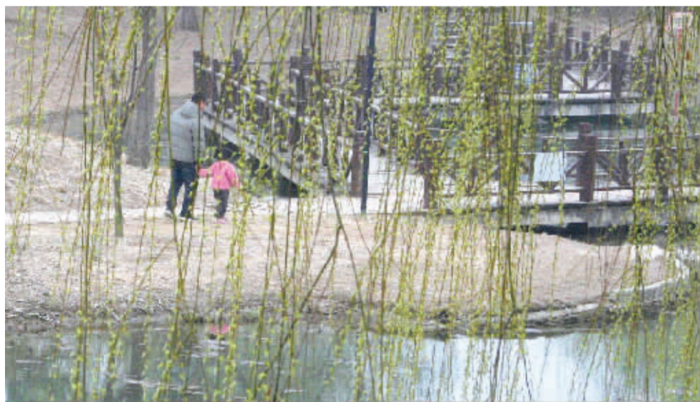
万条垂下绿丝绦