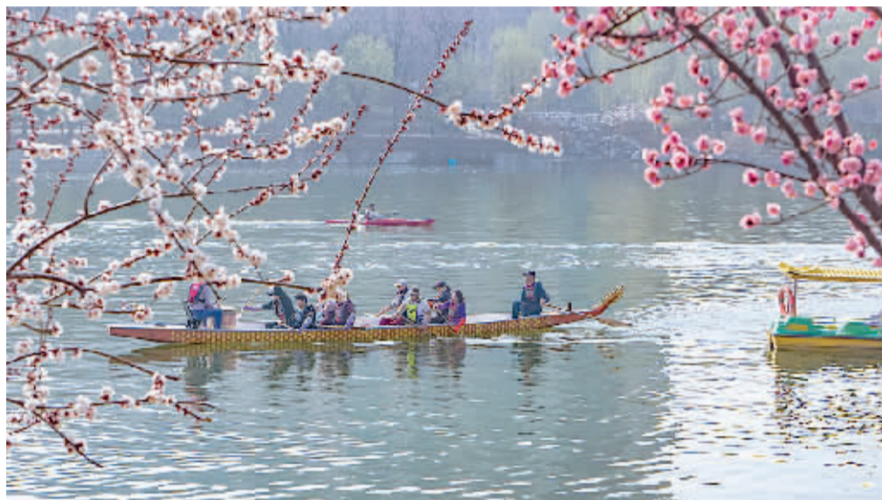
水光潋滟晴方好