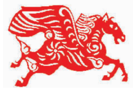
生肖马(剪纸) 白素菊/作