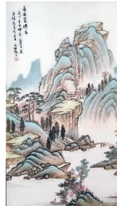
春溪览胜图 白文斌/作