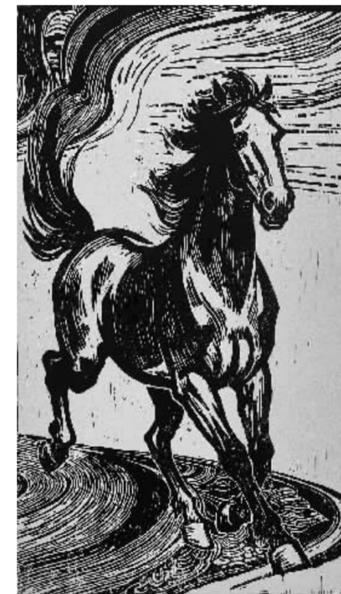
破空(黑白木刻) 闫巍/作