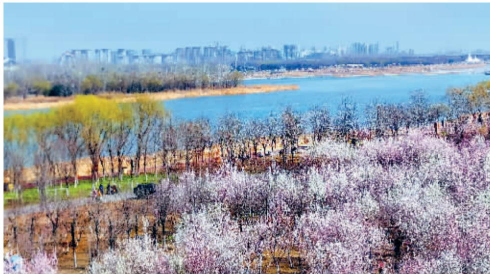
滹沱春色入画来