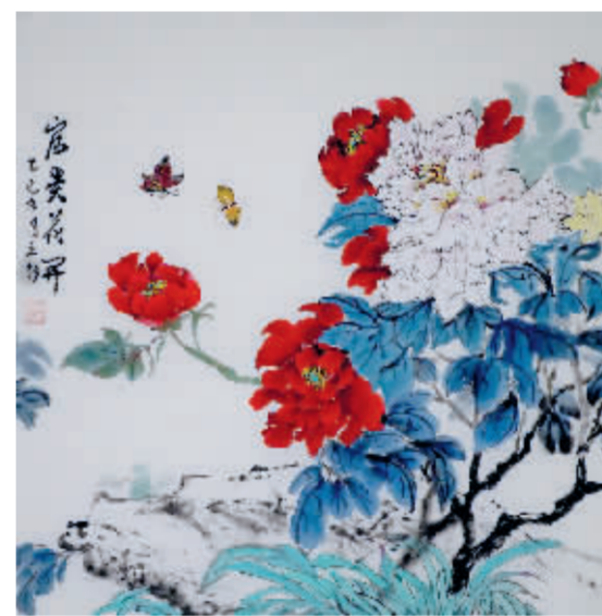
富贵花开 张立新/作