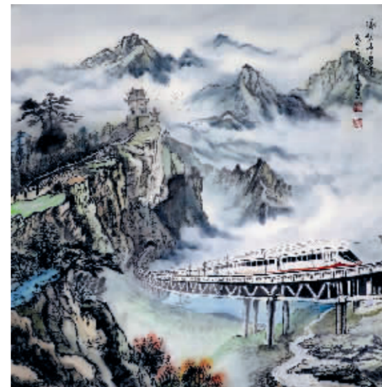
脉动中华 张荣珍/作