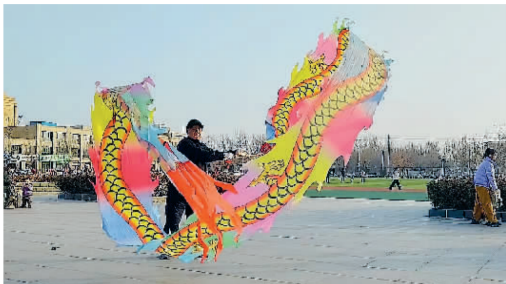
舞彩龙迎新春