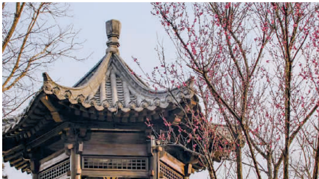
梅岭春早