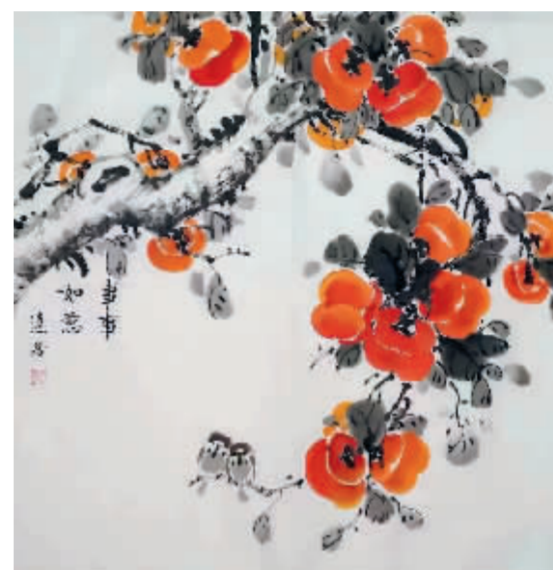
事事如意 檀连居/作