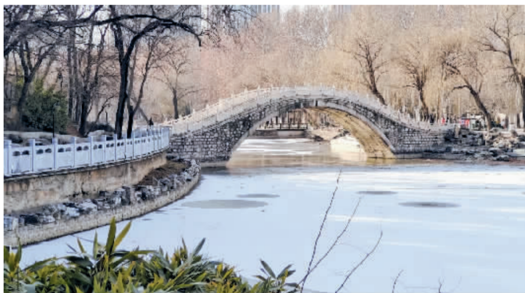
石家庄市裕西公园冬景