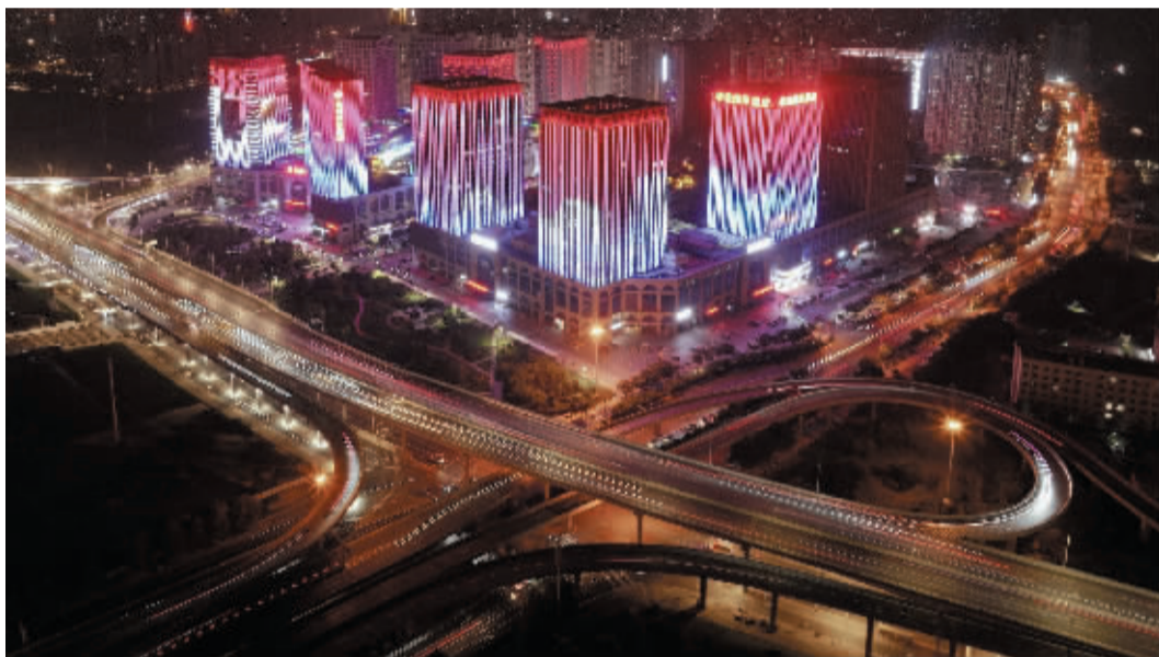
流光溢彩 航拍精品24-1班李银丽/摄(指导老师刘振兴)