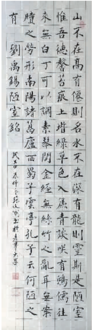
唐·刘禹锡《陋室铭》 张文刚/书