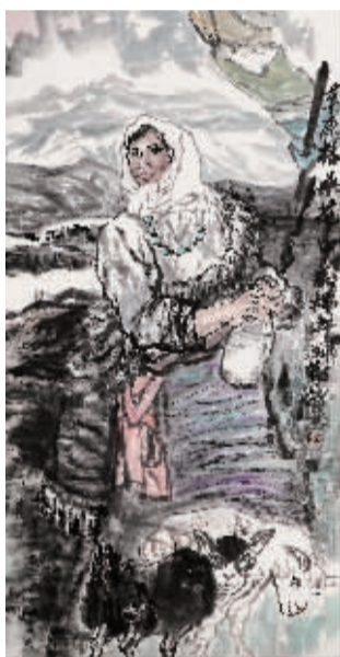
草原格桑花 刘勤/作