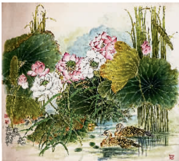
喜遇繁花 吉学先/作