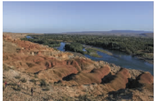
五彩滩 周新民摄于新疆阿勒泰地区布尔津县