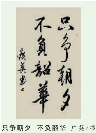
只争朝夕 不负韶华 广英/书