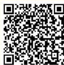
扫一扫 观看书画展视频