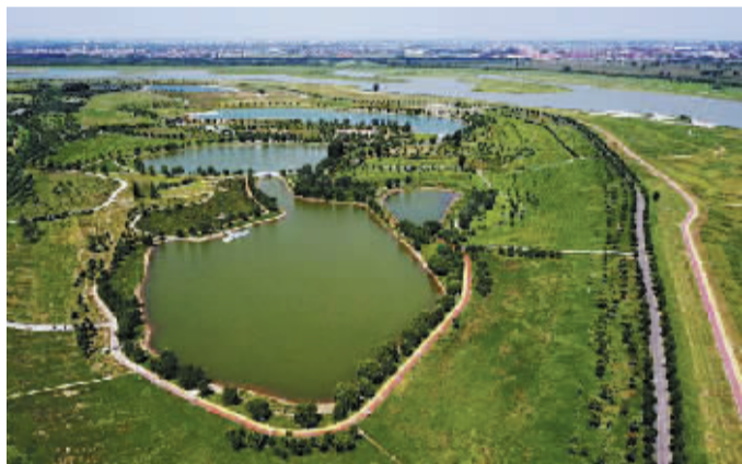
石家庄滹沱河畔,绿意盎然。波光粼粼的河面上,不时有水鸟掠过,一幅生态画卷尽显诗意。