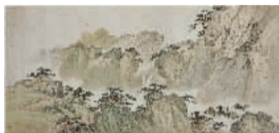
刘子久《山水图》(天津博物馆藏)