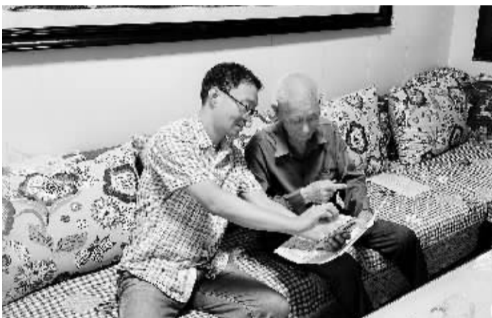
(晋州市委老干部局)

据了解,晋州市现有离休干部21人,年龄最大的已超过百岁。临近中秋佳节,老干部局负责同志带队,到每一位离休干部家中进行走访慰问,询问他们的生活起居,了解他们的身体状况,倾听他们的意见建议,并通报中心工作。