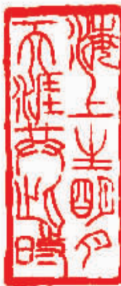
海上生明月 天涯共此时