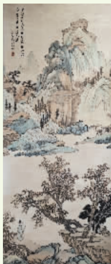
仿古山水 刘继红/作