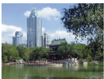
乌鲁木齐人民公园

彩虹飞架在碧波之上。大片的莲花水草间,时有水鸟起落、野鸭游弋。岸边的柳枝在微风中摇曳,像亭亭玉立的少女梳理着柔长秀发。鉴湖南岸的丹凤朝阳阁是公园的标志性建筑,建筑面积达 1500 多平方米。湖畔有曲径通幽的园中园、点缀亭旁庭前的雕塑。沿着公园便道南行,远远地就能看见高耸阁前的李白雕像,这