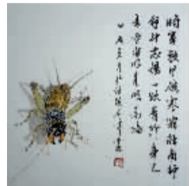
将军软甲破寒霜 石峰/作