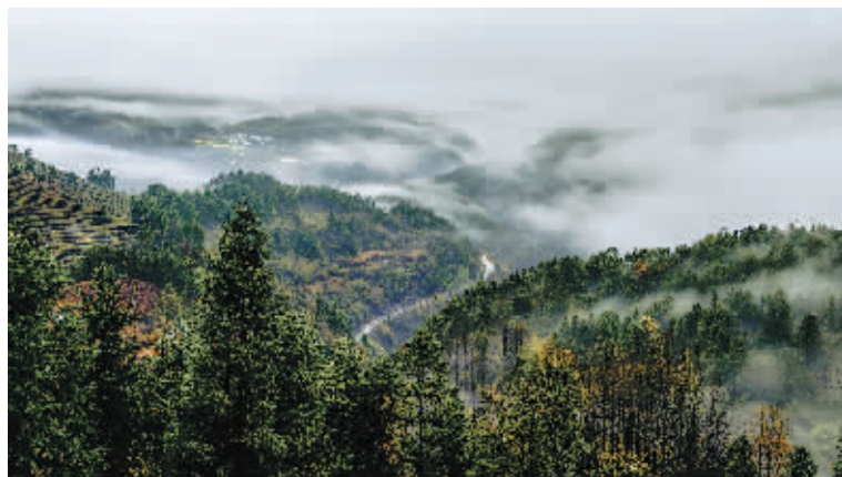
山峦叠影 张成林摄于江西婺源江岭