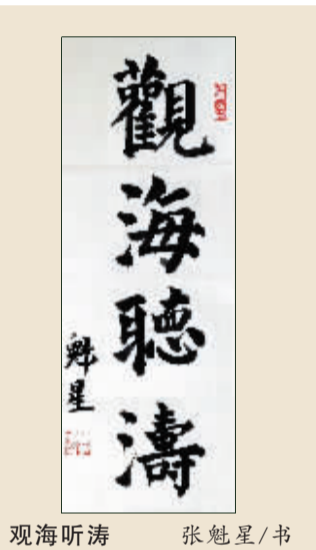
观海听涛 张魁星/书

五月田间如画屏, 堤边草木竞葱茏。 塘荷凝露青蛙唱, 麦如绿波抽穗盈。 桑葚晶莹墨含紫, 榴花火热绿衬红。 天道酬勤农家乐, 风调雨顺助粮丰。