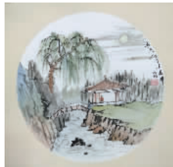
春光物态弄春晖 高旭珍/作