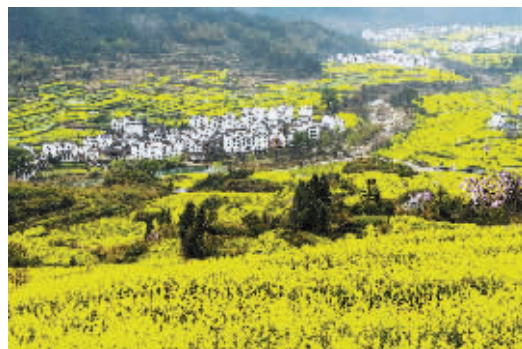
美丽的田野 李昊天摄于安徽省黄山市黟县芦村