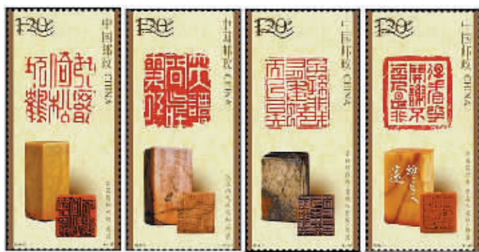
《中国篆刻(二)》特种邮票

邮票第一图为明代篆刻家文彭的“琴罢倚松玩鹤”青田石印章。规格为长3.3厘米，宽3.3厘米，高8.1厘米，现收藏于杭州西泠印社。这是一方文彭真印，布局、用刀沉稳、大方，边款以双刀行书为之，雅洁而富有韵味，尽显其精湛的技艺和深厚的文化底蕴。印顶有王福厂观款。邮票第二图为明代篆刻家何震的“笑谈间气吐霓虹”石章。规格为长4.05厘米，宽3.9厘米，高7.1厘米，现收藏于上海博物馆。何震所作的“笑谈间气吐霓虹”是其目前存世屈指可数的篆刻原石之一，作品用刀挺劲，起收笔刀痕显露，笔画具有猛利的效果，气势磅礴，篆法沉