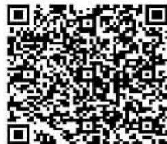
“我游我乐”微信群二维码

交车,植物园站下车。 作品提交方式: 1.平信。邮寄地址:石家庄市中山路313号新闻大厦1816室,邮编:050011 2.电子邮箱:limengcts@sina.com 3.扫二维码,加入“我游我乐”微信群,提交作品。 咨询电话: 0311-88629437