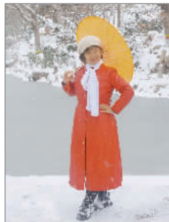
美在雪中

生活中,常常会有一些场合,给我们学以致用的实践机会;也会有一些时候,让我们体会到知识就是力量。您是怎样将所学的知识,应用于解决问题呢?