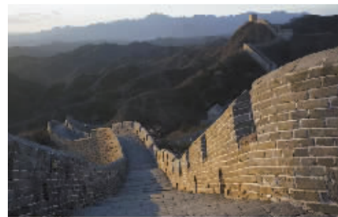
长城岁月 何伟摄于河北金山岭长城