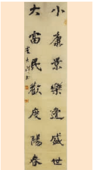
小康景乐逢盛世卢大娟/书

闲暇伏案读书卷， 唐诗宋词和楹联。 唐诗熟读三百首， 宋词已阅三百篇。 楹联新作上下联， 春联寿联和乔迁。 勤学不辍增知识， 新春读写书香伴。