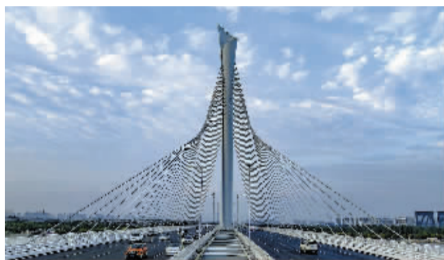
蓝天白云下的滹沱河特大桥。通讯员 邢宇森 供图

我主要负责滹沱河特大桥项目部的技术指导。滹沱河特大桥主塔钢筋工程、主塔吊装精度以及桥梁的偏差要控制在10毫米以内,稍有偏差就会影响车辆行驶的安全性和舒适性。那段时间里,我每天都到施工现场询问各项工程的测量数据,并将数据记到本上汇报给领导。由