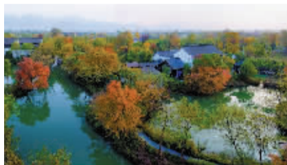
西溪国家湿地公园

西溪湿地的芦苇面积约有360亩,分布在蜿蜒曲折、纵横交错的河流湖泊中,其间还穿插着众多港汊和鱼鳞状鱼塘,形成了独特的湿地景致。观赏芦花的最佳方法是泛舟游览,一叶扁舟沿水路缓缓前行,穿梭在芦田间,船工在后,慢桨轻橹,游客在前,谈笑风生,一路摇进芦荡深处,别有一番情趣。