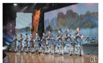
图①为表演唱《太行山上》;图②为情景剧节目《风华正茂》;图③为时装表演《大美中国》。本报记者 李泽佳 通讯员 诸葛泊钊 摄