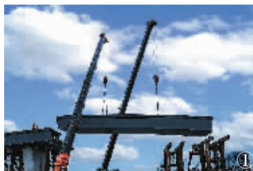
图①为孙宏普拍摄的《酣战北三环》组图之一。