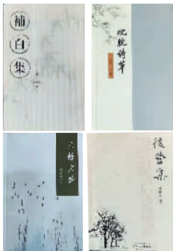
本文作者王继山出版的4本书

六记》忆童年,《岁华九章》记1949年至2019年70年间的沧桑故事,《庙街》为早年的市井百姓、痴男怨女立传。