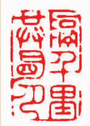
隔千里共明月 吴明/作