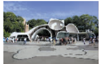
成都大熊猫繁殖基地

大熊猫繁殖基地位于成都北郊斧头山侧面的浅丘上。基地有科研大楼、实验室、熊猫活动场所等设施,是集自然山野风光和优美人工景观为一体的生态景区。走进基地,我立刻被憨态可掬的大熊猫所吸引。大熊猫肚子是白的,背部是黑色的,头上有一对八字型的黑眼圈,像是戴上了一副墨镜,眼睛两侧长着一对毛茸茸的黑耳朵,尾巴很短,像一团绒球贴在屁股上,娇憨可爱。一只独自吃竹子的大熊猫,憨态可掬,面对众多游人一点也不在乎,只顾津津有味地啃着竹子,只见它用一只前爪把竹子放到嘴边,用尖尖的牙齿快速地把竹子皮啃下来,把剩下的竹芯一点点吃掉,那憨呆的样子,引得游人发出阵阵笑声。