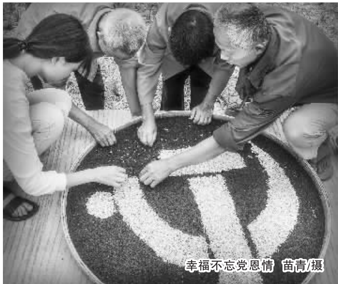
幸福不忘党恩情

黄瓜短,丝瓜长; 西瓜圆,冬瓜胖; 南瓜和甜瓜, 一点儿也不像; 地瓜藏地下,木瓜爬树上。 一群瓜娃娃,各有各的样。